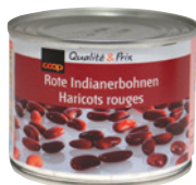
Coop rote Indianerbohnen , 215 g

Was Sie ausserdem benötigen: ■ Zwiebel ■ Öl zum Braten ■ Weissmehl ■ Rotwein ■ Cayennepfeffer ■ Chilipulver ■ Salz