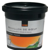
Coop Fine Food Rindfleischbouillon , 90 g