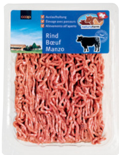
Coop Naturafarm Rindhackfleisch , ca. 300 g