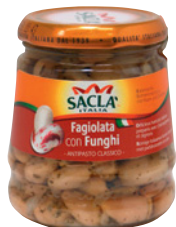
Saclà weisse Bohnen , mit Pilzen, 290 g