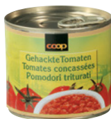
Coop gehackte Tomaten , 230 g