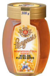
Miel liquide Langnese, 500 g