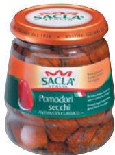
Tomates séchées à l'huile Saclà, 280 g