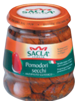
Tomates séchées à l'huile Saclà, 280 g