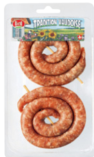
Saucisses à rôtir en spirale Bell, 2 x 130 g