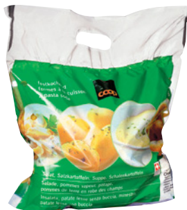
Pommes de terre Coop fermes à la cuisson, 2 kg